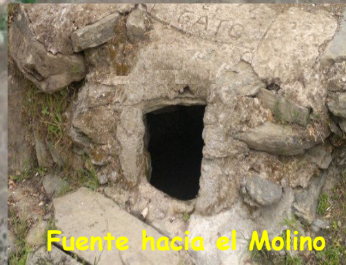
Fuente hacia el Molino