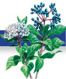
Durillo Viburnum tinus

Desde Villarreal, por viejos caminos, podemos llegar a algunas localidades del entorno del Parque. También hay rutas que, aunque no parten del Parque, lo hacen desde las poblaciones próximas y recorren parajes de reconocidos valores naturales o paisajísticos.