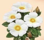
Jaguarzo morisco Cistus salvifolia

● Villarreal-Portilla del Tiétar (12 km) Paradas en distintos e interesantes miradores para observar avifauna, como La Tajadilla, La Báscula, La Higuera o la Portilla del Tiétar. También se pasa, antes de llegar a la Fuente de los Tres Caños, por un punto de interés geológico. Todos los miradores están señalizados y cuentan con pequeñas áreas de aparcamiento.