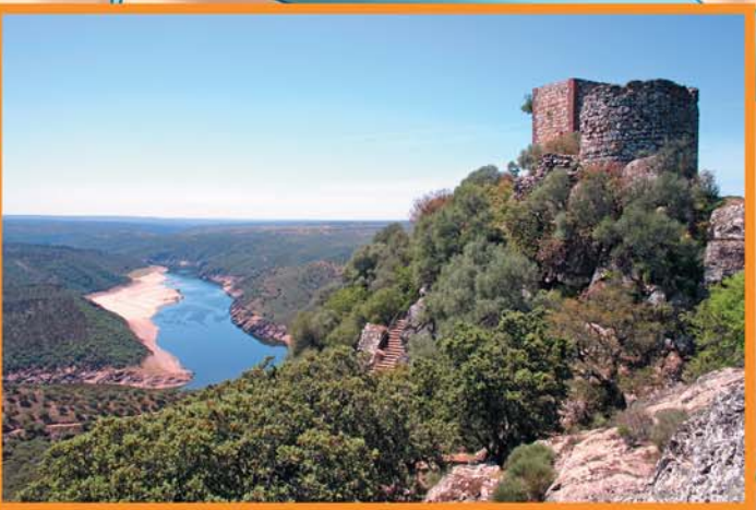
Vista del castillo de Monfragüe con el río Tajo al fondo