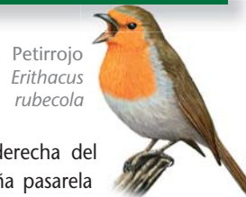
Petroirrojo Erithacus rubecola