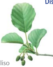
Aliso Alnus glutinosa

Distancia: 8,5 km. (Trayecto de ida y vuelta) Duración: 3 horas aproximadamente