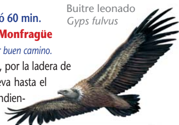
Buitre leonado Gyps fulvus