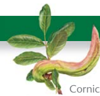
Cornicabra Pistacea terebinthus

También desde el tramo 1 (puente de abajo de Malvecino) podemos tomar la ruta que recorre la margen derecha del arroyo (casi un kilómetro de fácil y grato recorrido). Hay numerosas pasarelas de madera que facilitan el paseo por Malvecino, un lugar fresco y agradable con abundante vegetación de ribera. Aparecen algunos ejemplares sobresalientes de fresno, madroñera y cornicabra.