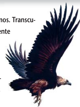
Buitre negro Aegypius monachus

Ruta para hacer a pie organizada con diversos tramos. Transcurre por distintos tipos de vegetación, principalmente de ribera, aunque no desmerece su riqueza paisajística o histórica desde lo alto de Cerro Gimio (panorámicas y restos de una atalaya romana). Desde Villarreal, el itinerario cuenta con varias alternativas en un recorrido de 7,5 km, cuya duración es aproximadamente de 2 horas y 30 minutos.