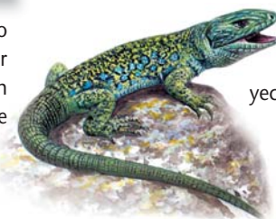
Lagarto ocelado Timon lepidus