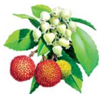
Madroño Arbutus unedo